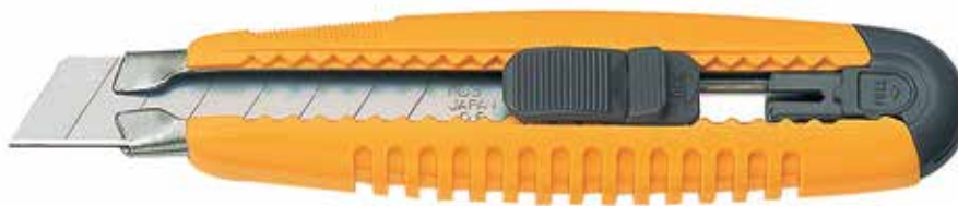
G-11 SAFETY G Cutter super resistente e con un buon grip