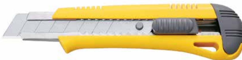
L-18 AUTO LOCK Cutter con blocco di sicurezza automatizzato scorrevole