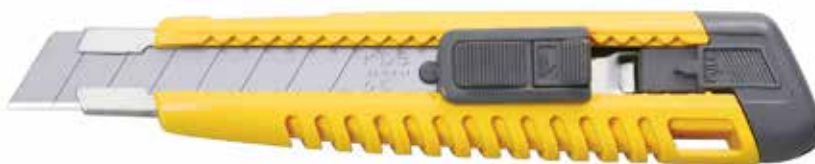
L-11 SAFETY L Cutter con blocco di sicurezza ad una sola mano