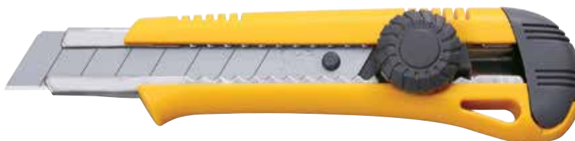
L-19 TWIST L Cutter con blocco di sicurezza automatizzato con rotella