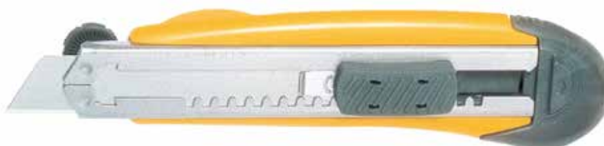
L-21 AUTO FEEDER Una lama a tre pale, per mantenere un bordo affilato per un tempo più lungo